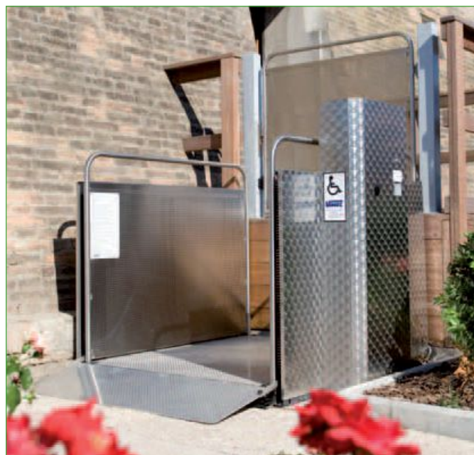
Versión de acero inoxidable (opcional)