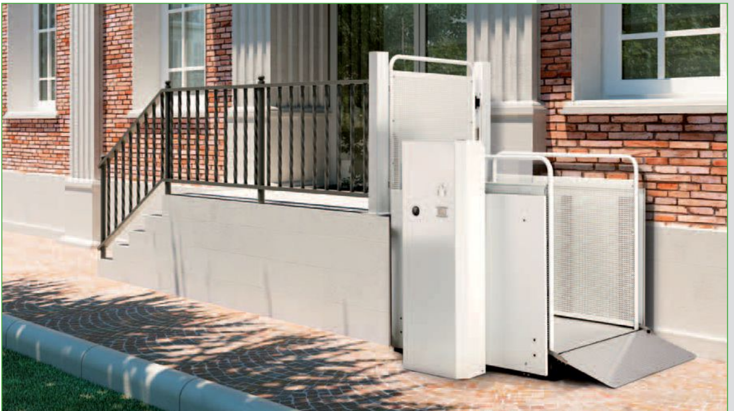
Versión estándar de acero pintado RAL 9018 (blanco papiro)