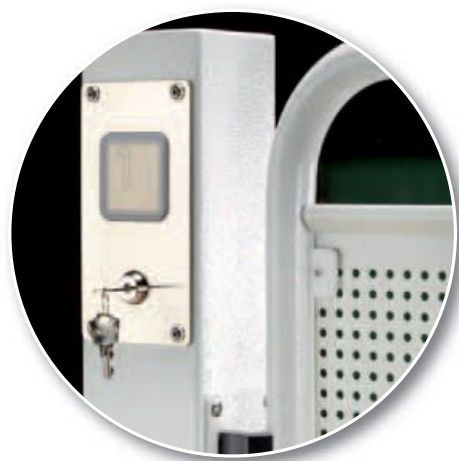
Botonera de piso